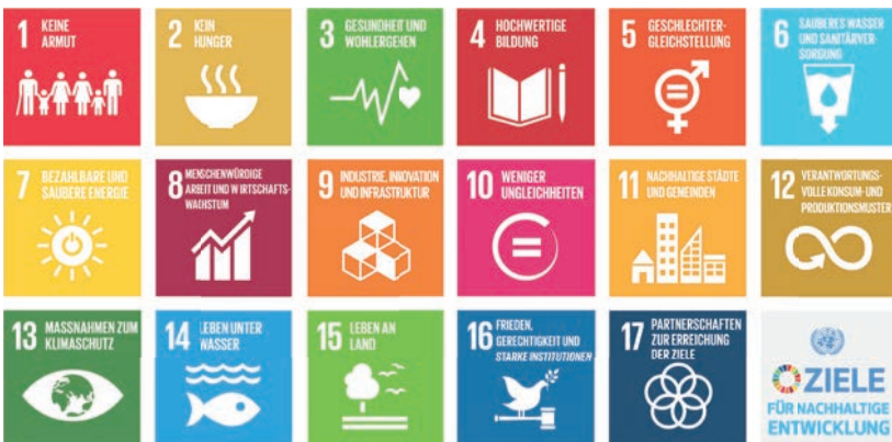
Ziele nachhaltiger Entwicklung 2030 der Vereinten Nationen