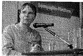
Senatorin Anja Hajduk auf der Gemeinschaftsveranstaltung des Baugemeinschaftsforums und der Demographie-Plattform

Im Rahmen des Interreg-Projektes DC NOISE – „Demographic Change – New Opportunities In Shrinking Europe“ arbeitet das Amt für Landesplanung und Landschaftsplanung mit transnationalen Partnern aus Schottland, Belgien, den Niederlanden und aus Norwegen an Themen des demographischen Wandels in Europa. Fragen des Arbeitsmarktes, der Regionalentwicklung und des Wohnens stehen dabei im Vordergrund.