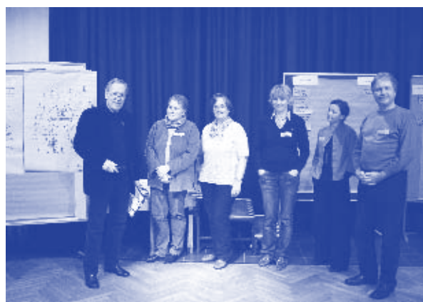
Bewohner und Akteure entwickeln gemeinsam die Ziele für das Projektgebiet

Die vorhandenen Bildungsangebote sollen unter anderem durch das Projekt KIKU ergänzt werden. Durch die Zusammenarbeit von Lohbrügger Schulen mit einem Kulturträger werden die kulturellen, sozialen und kommunikativen Kernkompetenzen von Kindern gestärkt. Das Projekt erhöht außerdem die Bildungsgerechtigkeit, weil auch benachteiligte Kinder erreicht werden.