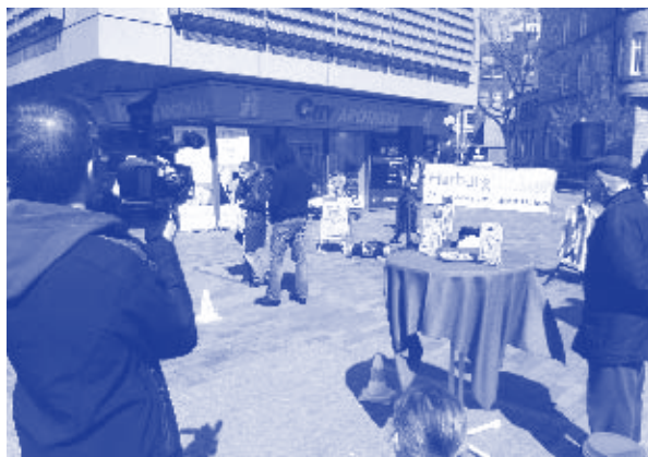
Aktion für Zivilcourage in der Harburger City

Menschen mit Zivilcourage treten Gewalt selbstbewusst entgegen. Dazu braucht es nicht nur Mut, sondern ebenso eine realistische Einschätzung der jeweiligen Situation und der eigenen Handlungsmöglichkeiten. Zivilcourage hat nichts mit falsch verstandenem Heldentum zu tun und niemand sollte seine Gesundheit oder gar sein Leben riskieren. Aber wie kann ich verhindern, dass ich mich in solchen Situationen selbst gefährde?