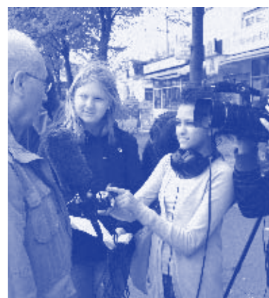
Filmteam „Lurup meine Perle ...“

mit der Programmierung beschäftigt. Anfang des neuen Schuljahres kann die Datenbank von Luruper Schülern genutzt werden.