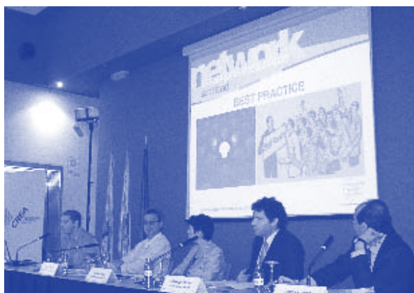
Präsentation der Best Practices aus Europa bei der Abschlusskonferenz in Zaragoza

Unternehmer/innen und Gewerkschaftsvertreter/innen zusammen, um verschiedene Ansätze und Strategien zu diskutieren.